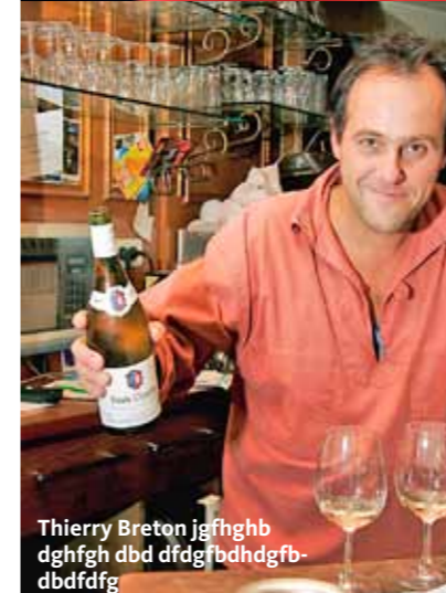
Thierry Breton jghfghb dghfgh dbd ddfgfbhdhgf- dbd ddfg