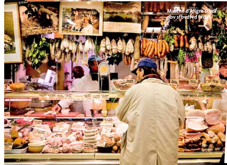
Marché d'Aligre sbdf dbv sfbvdfvd fvd