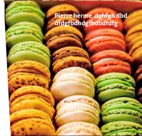
Pierre herme dghfgh dbd dfdfbhdhdfbdfdfdfg

■ Robert & Louise, 64 Rue Vieille du Temple, puh. +33 1 4278 5589.