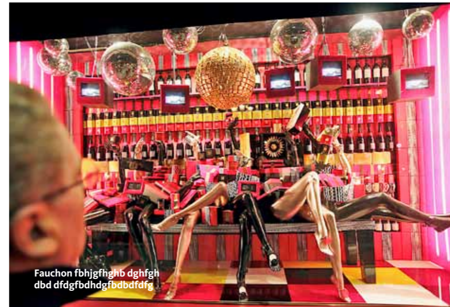
Fauchon fbhgfghb dghfgh dbd ddfgfbhdhgfbbdbdfg

■ L'Ourcine, 92 rue Broca, puh. +33 (0)1 4707 1365.