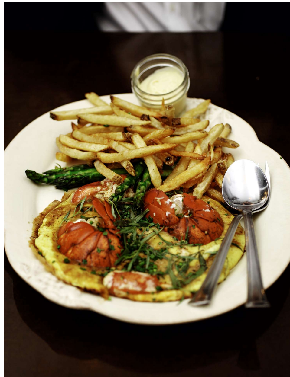
Kuvatekstiotsikko. Tähän yhteinen kuvateksti koko kuvaryppäälle.

Ettei oikein kamera ja vielä salamakin. Ja iii-so linsi. Sinä se taidat olla joku taiteilija. Oletkos kuuluisakin?" vinoilee sänkileukainen mies kuvaajalleni ei lainkaan ystävälliseen sävyyn montrealilaisen Joe Beef -ravintolan baaritsikilla. Valokuvaaja piipittää naama punaisena, että töitähän tässä vaan. Minä taas yritän selittää ikävälle isännälle, että tulemme kaukaisesta Suomesta ja halusimme tehdä juttua tästä ehtoisan oloisesta ravintolasta.