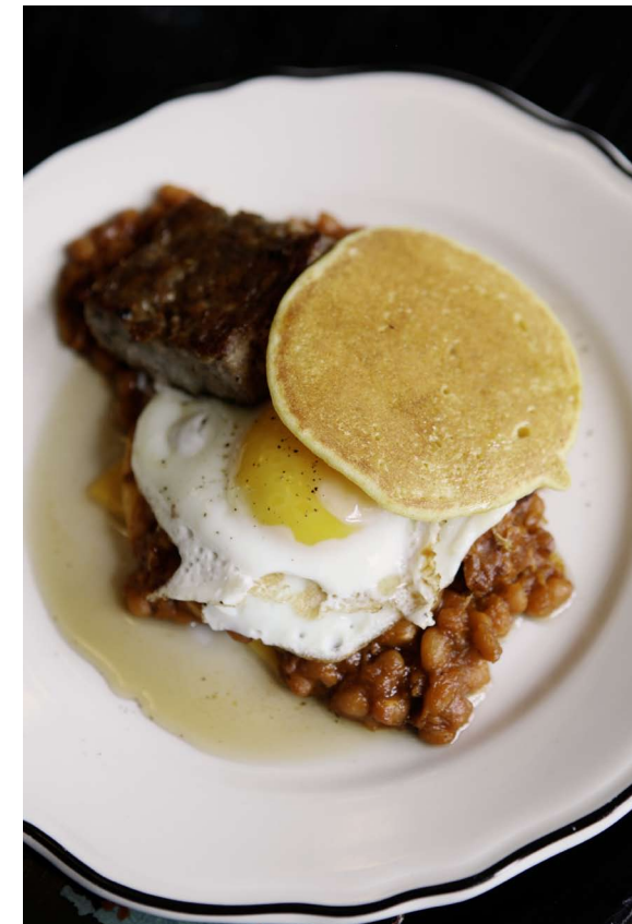
Kuvatekstiotsikko. Tähän yhteinen kuvateksti koko kuvaryppäälle.